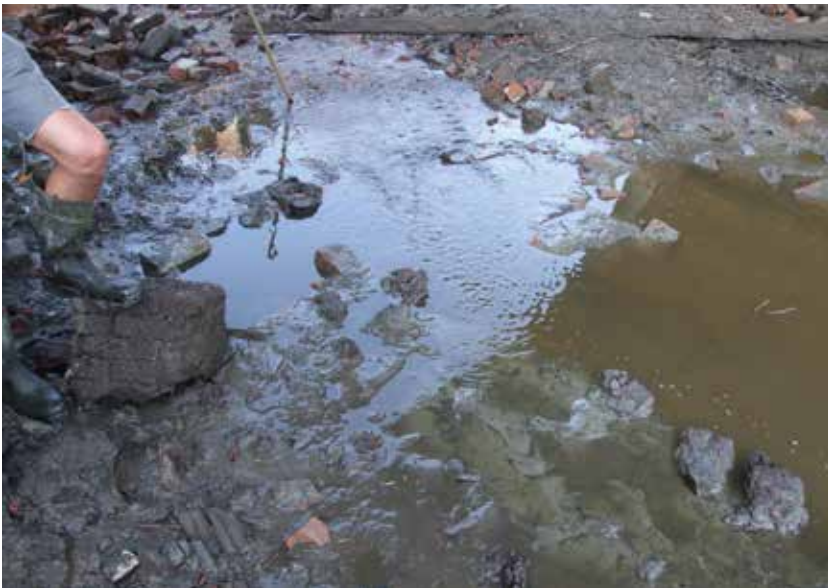
De drooggelegde Steentil vlak voor de restauratie in 2009. Op de tweede foto zijn de paalkoppen te zien.

daarheen is geleid. Zijn theorie is overgenomen door alle onderzoekers die zich sindsdien met het onderwerp bezighielden, zoals Kloppenburg, Van den Broek en meest recent Mol en & Delvigne. Het is hier niet de plek om al deze verhandelingen te analyseren. Hier kan worden volstaan met de constatering dat in al deze publicaties de omgeving van Fransum het terrein van handeling is geworden, waardoor men een nieuw gegraven diep in een gebied projecteerde, waar deze nooit heeft gelopen. Zowel de Middagster Riet als het