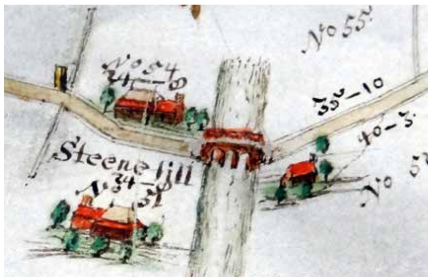
De nog driebogige Steentil en omgeving, ca. 1685. Detail uit de kaart van de wagenweg en de zomerweg tussen de stad Groningen en Friesland, ca. 1775.

1924 stelden Nanninga Uitterdijk en Post in hun studies over de abdij van Aduard dat het hier ging om het graven van het Aduarderdiep en het leggen van de sluis bij Aduarderzijl. 9 Na 1924, toen de naam 'Arbere' gekoppeld geraakt was aan de boerderij ten zuiden van Fransum, schreven alle in de inleiding genoemde onderzoekers dat hier niet het Aduarderdiep bedoeld werd, maar het Peizerdiep/Kliefslootsysteem of de Middagster Riet en dat het Aduarderdiep veel later, zo rond 1400 moet zijn gegraven. 10 Merkwaardig is wel dat de meeste auteurs niet de complete tekst van de oorkonde in de discussie betrokken, want naast 'Arbere' worden nog vier andere geografische referenties genoemd – nl. de kerkbrug, de wagenbrug, Swachcluse en Huchslote – die gezamenlijk meer duidelijkheid kunnen verschaffen. Eerst worden de bepalingen besproken die hier rechtstreeks betrekking op hebben. Daarna volgen enkele andere zaken waarvan de lezing afhankelijk is van de interpretatie van deze hoofdbepalingen.