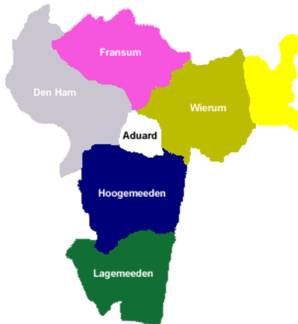
Gemeente Aduard 1811-1990 (Wierum zonder 'geel')